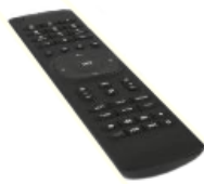
Dálkové ovládání 2x AAA baterie