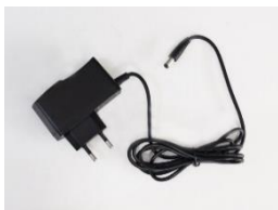
Zdroj, kabel pro připojení do napájecí sítě (230V)